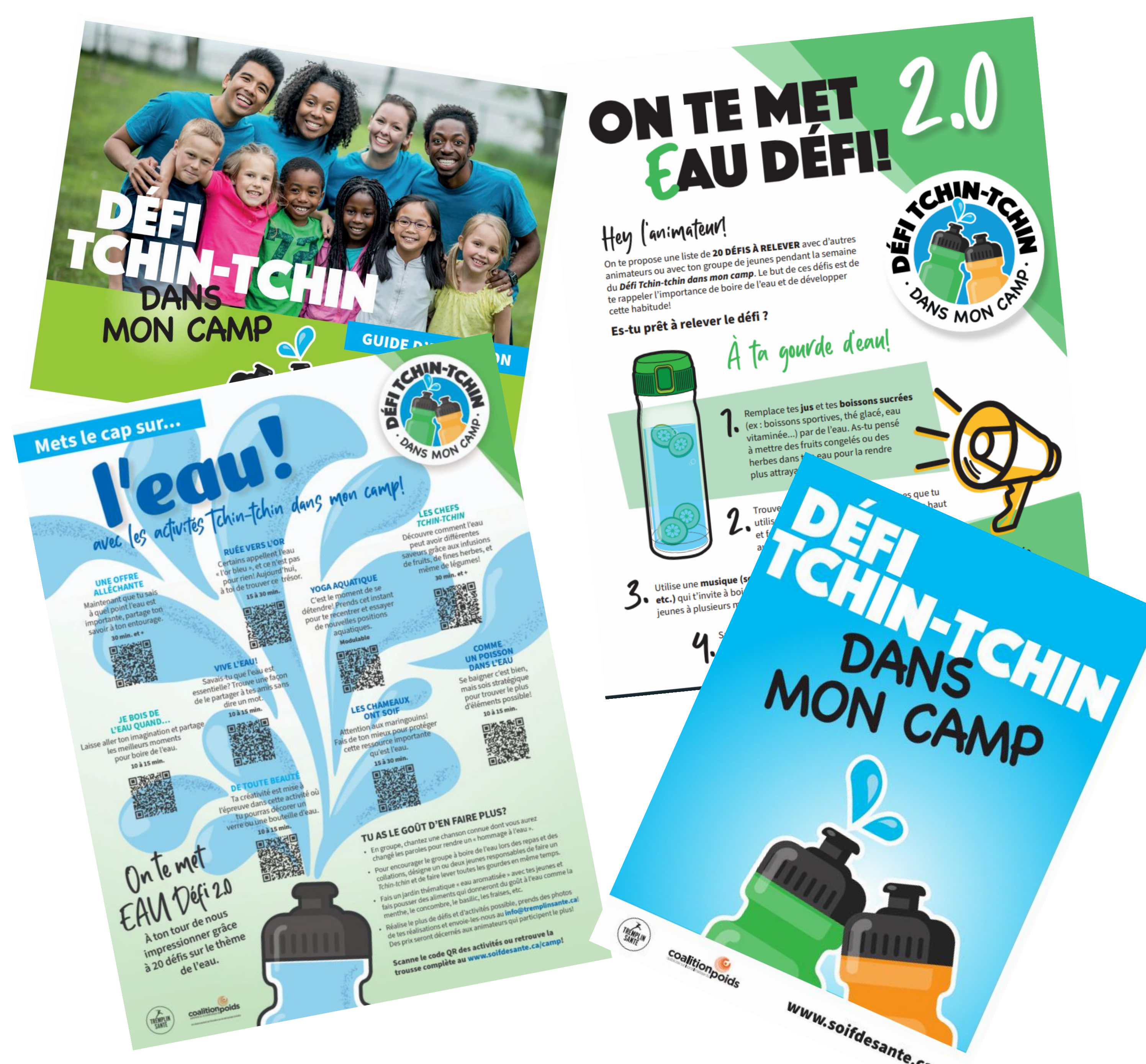
Outils du Défi Tchîn-tchîn dans mon camp.