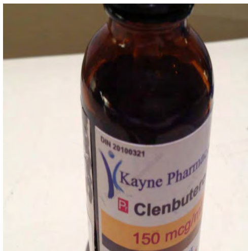
Figure 2 Clenbutérol 150 mcg/ml solution injectable

Une patiente aurait avoué au médecin consultant avoir acheté le produit par l'entremise d'un contact dans un centre d'entraînement sportif (comme la plupart des autres patients). La bouteille de la patiente semblant suspecte, une recherche a été faite sur le site Internet de la compagnie « pharmaceutique » canadienne (figure 2). Après vérification, le DIN (numéro d'identification d'un médicament homologué par Santé Canada) indiqué sur la bouteille de clenbutérol injectable 150 mcg/ml était faux. Malgré qu'il s'agisse d'un produit pour injection, il semble que la patiente le prenait par voie orale. Une analyse urinaire a confirmé la présence de clenbutérol chez cette patiente.